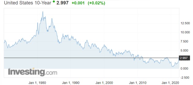
Lãi suất trái phiếu chính phủ Mỹ kỳ hạn 10 năm cán mốc 3%