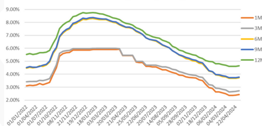
Lãi suất Tiền gửi niên yết trung bình

Theo khảo sát gần nhất, lãi suất huy động cao nhất kỳ hạn 3 tháng là 3,5%/năm (tại MSB, NCB); 6 tháng là 4,7% (tại KLB); 12 tháng là 5,4% (tại Oceanbank).